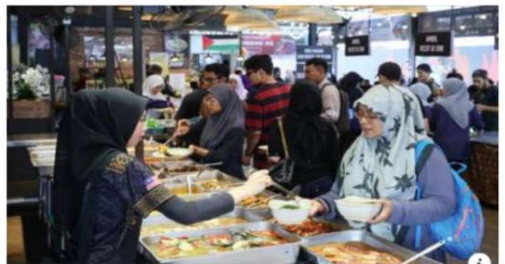
BERITARTEM.GOV.MY Jangan guna polistirena, kuat kuasa mulai 15 Julai - MPK KANGAR, 8 Jun- Semua premis kedai, gerai dan penjaja makanan dan minuman dalam ka...