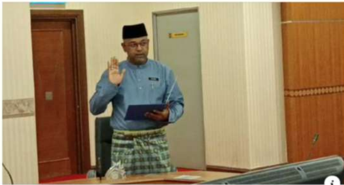
NST.COM.MY Kangar Municipal Council aims to slash RM26 million in assessment tax arrears | New Straits Times

#NSTnation Kangar Municipal Council aims to slash RM26 million in assessment tax arrears #Kangar #Tax #MunicipalCouncil